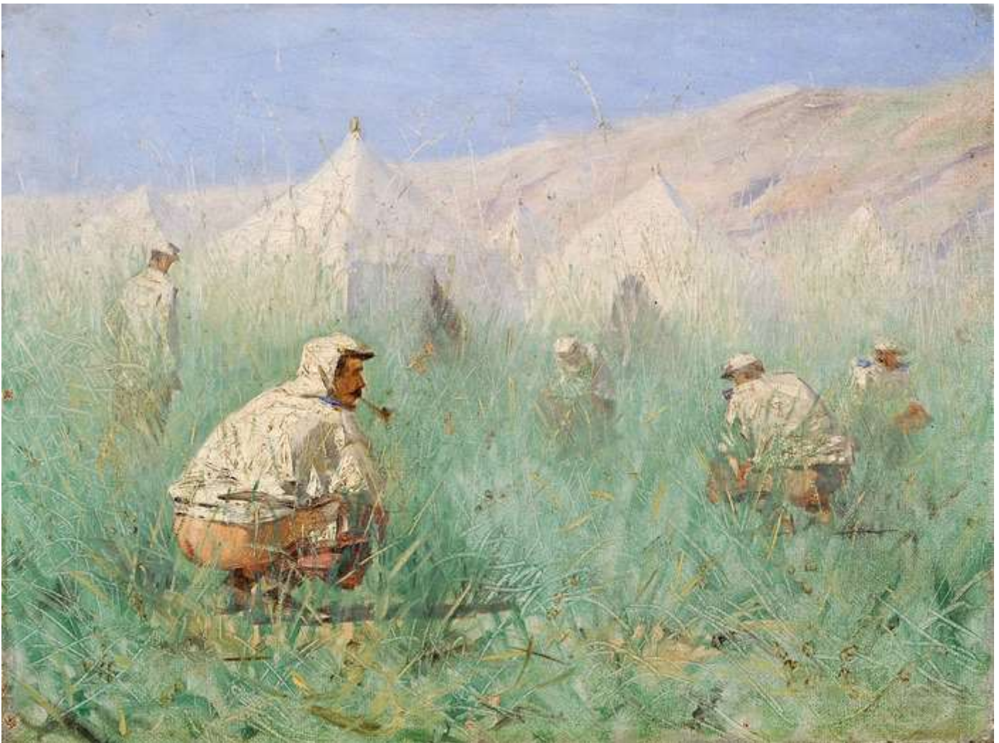
В. В. Верещагин. Русский лагерь в Туркестане

Известно, что мы также, живя даже в северном климате, летом едим мясного и жирного по необходимости гораздо меньше, чем в холодные времена года, и что гораздо скорее в летнее время платимся за неосторожность — в виде пресыщения очень питательной мясной и жирной пищей, вероятно, в зависимости от наибольшего брожения в кишечнике в жаркое время. Известно, что жители холодных стран съедают много мяса и жира, даже безнаказанно пьют жир (эскимосы и др.).