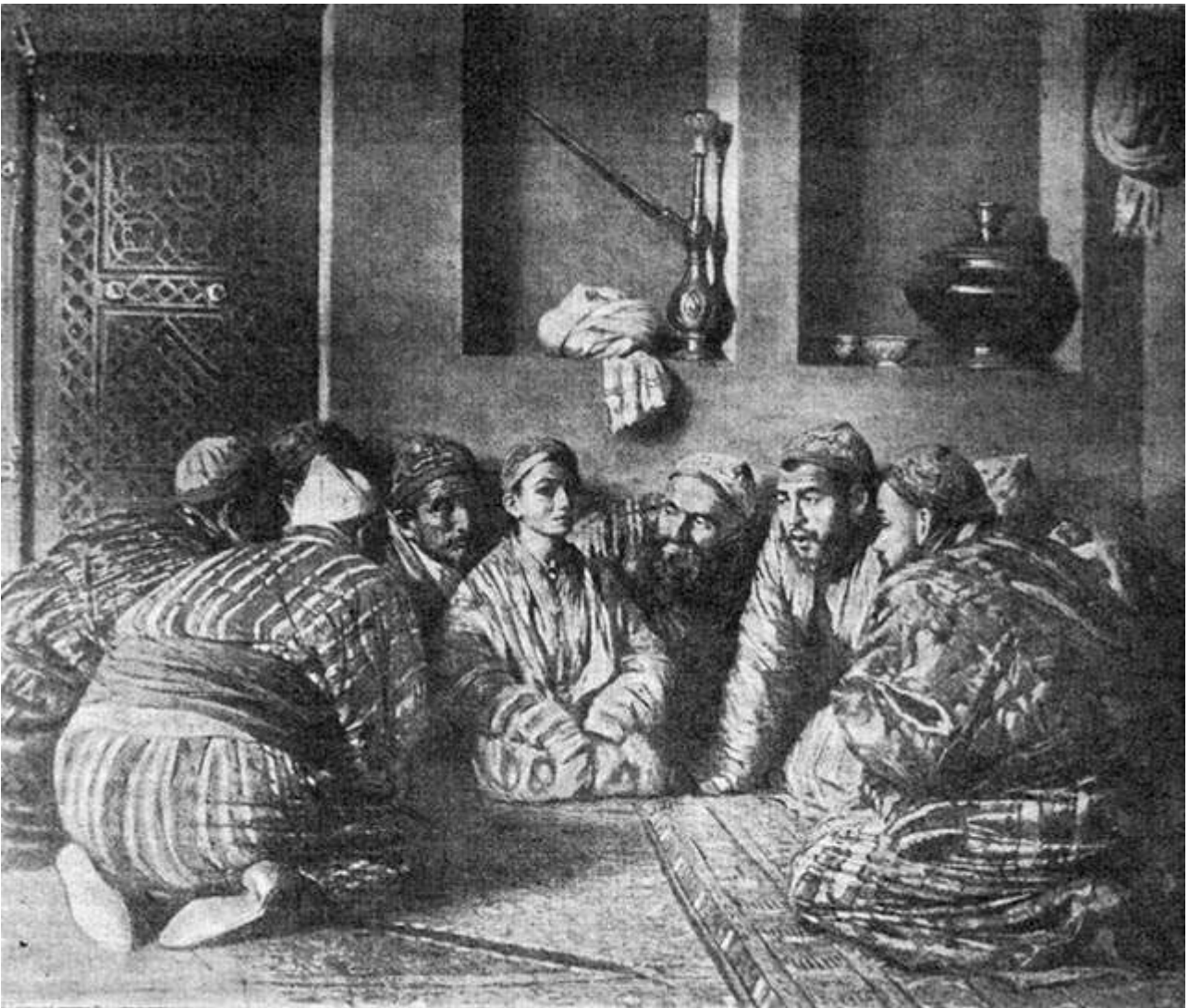
В. В. Верещагин. Бача и его поклонники. 1868. (Картина была уничтожена художником, после того как парижская публика сочла ее «неприличной»)

Целый circulus vitiosus явлений жизни сартовского народа, вероятно, связан с вышесказанной аномалией, причины которой также лежат иногда в болезнях психических, наследственных или свойственных старческому возрасту, а иногда и в другой, предшествующей ослабляющей аномалии, знакомой закрытым заведениям; да, кроме того, в продолжительном безбрачии, благодаря бедности, в изоляции полов друг от друга, даже в унижительном восточном мусульманском взгляде на женщину как на рабу или низшее животное, в угнетенном и загнанном ее положении.