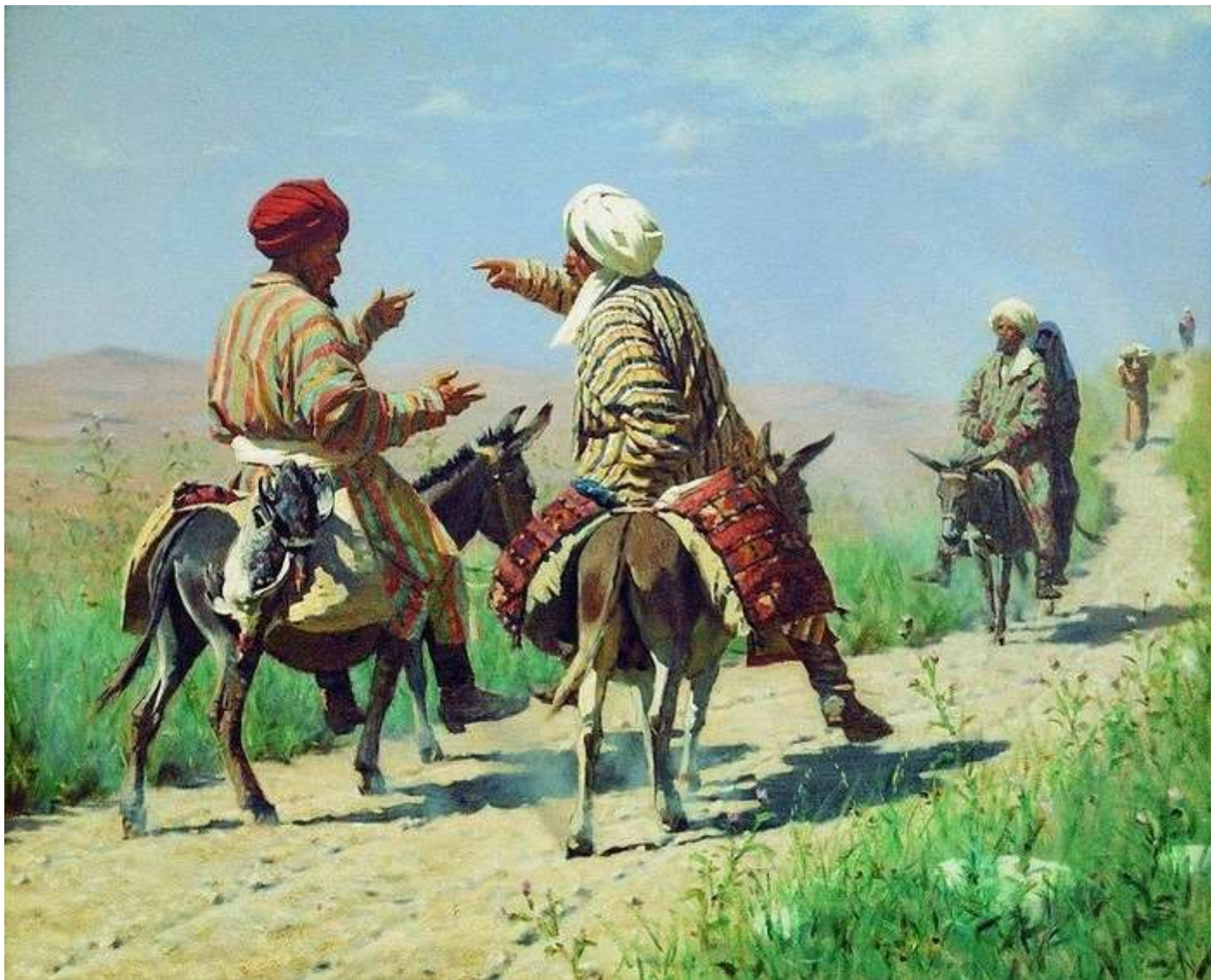
В. В. Верещагин. Мулла Керим и мулла Рахим по дороге на базар ссорятся. 1873