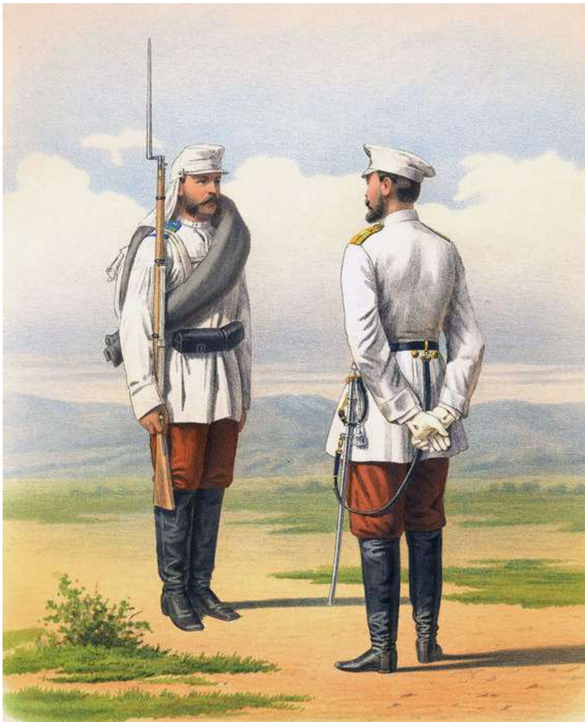
Рядовой и обер-офицер туркестанского линейного батальона (походная и обыкновенная форма). 1877

Об акклиматизационной способности русских в Туркестанском крае. Бывавшие в местностях Туркестанского края, особенно в первый раз, поражаются мелькающей пестротой населения, в которой усматриваются два главных типа: русский и сартовский, — на них и придется остановиться. Русский человек, как это бросается постороннему в глаза, в усиленной теплоте этих стран разнеживается, покрывается бóльшим запасом подкожного жира, увеличивается в росте и прочих размерах, словом, в массе, каковой кажется, напр., войско, представляет, особенно в воображении сарт, импонирующую красоту и непоколебимую силу. В самом деле, можно залюбоваться на цветущие лица и могучие груди и удивляться сильным голосам туркестанских солдат, когда они идут с песнями по улицам, богатым резонансом. Местные офицеры рассказывают, что уже через год молодые, находящиеся еще в периоде роста скелета туркестанские солдаты значительно вырастают из своих сюртуков, благодаря быстрому общему физическому усовершенствованию их под влиянием климата. Но это только одна часть русского населения и одна сторона его — внешняя и условная. За ней скрывается внутренняя