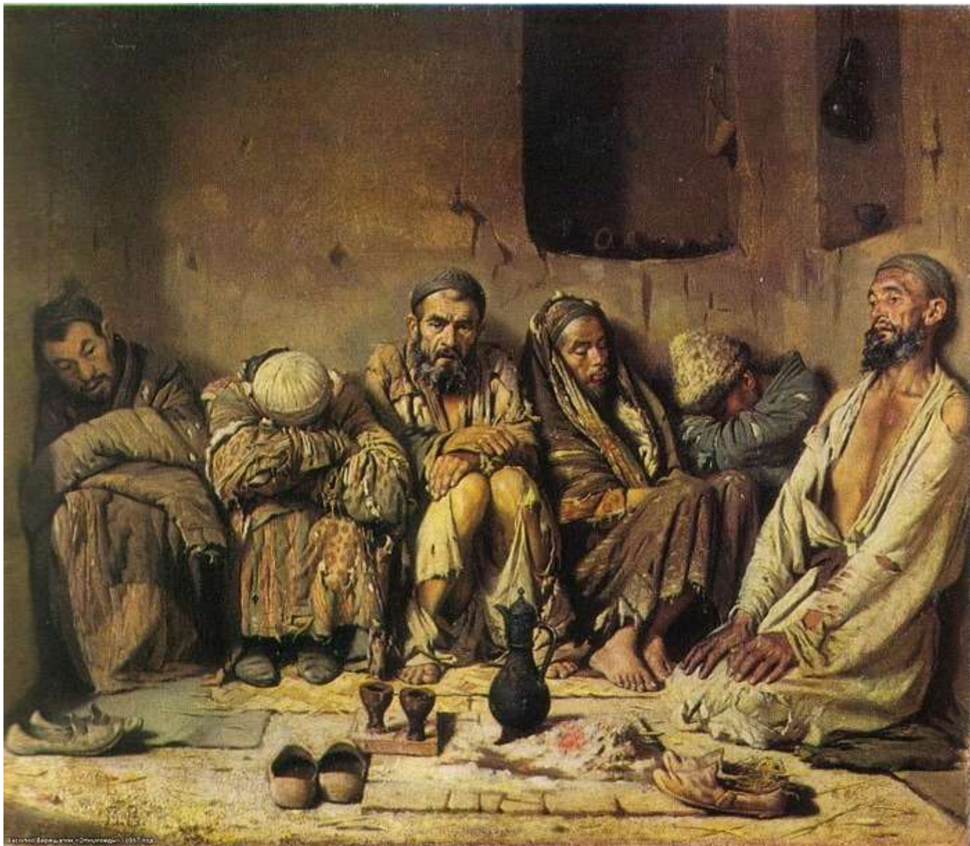
В. В. Верещагин. Опиумеды. 1868

Поскольку туземные наркотические средства проникают и к русскому населению, судить трудно, но я слышал об отдельных случаях привычного уже употребления опия и гашиша у некоторых солдат. Что касается обратного воздействия русских одуряющих средств, то в Ташкенте между сартами, как и в степи по станциям, между киргизами, к сожалению, спиртные кабачные напитки начинают уже заметно производить свое вредное действие. Сарты не только пьют, но даже начинают пьянствовать с увлечением новичков, что тем более печально, что они, согласно Корану, пьют не вино, запрещенное им, а водку, о которой в Коране ничего не сказано. Масса пьяных сарт, народа вообще обычно весьма трезвого и воздержного, гуляла по улицам в народный праздник в Ташкенте, праздновавшийся с окончанием летнего поста. Но к характеристике нравов я должен упомянуть и об особенном трогательном участии к подкутившим забиякам со стороны остальных, трезвых сарт, которые их оберегали и водили под руки. Бурных и безобразных сцен столкновения с уличными блюстителями порядка не видно было, вероятно, потому, что в Ташкенте преимущественно своя туземная полиция.