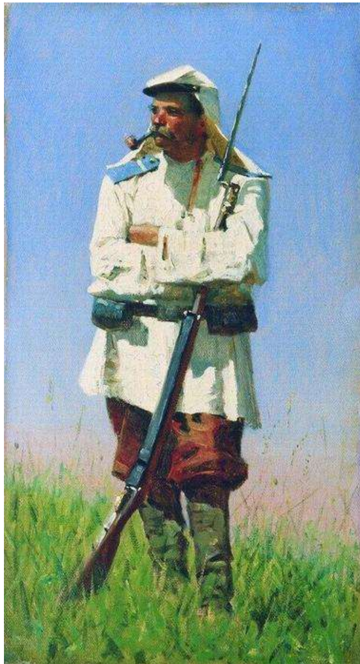
В. В. Верещагин. Туркестанский солдат в зимней форме. 1873

К слабой стороне акклиматизационной способности русских в Туркестанском крае нужно отнести и громадную заболеваемость солдат кишечными расстройствами, по сравнению с туземцами.