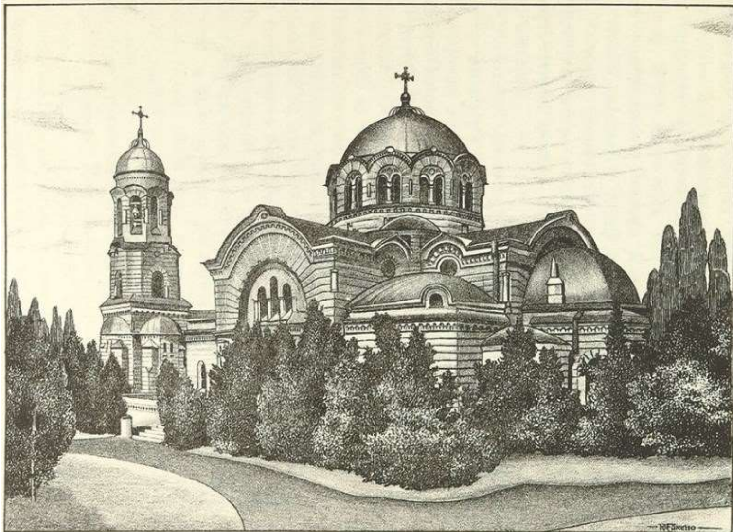
Военный Спасо-Преображенский соборъ.